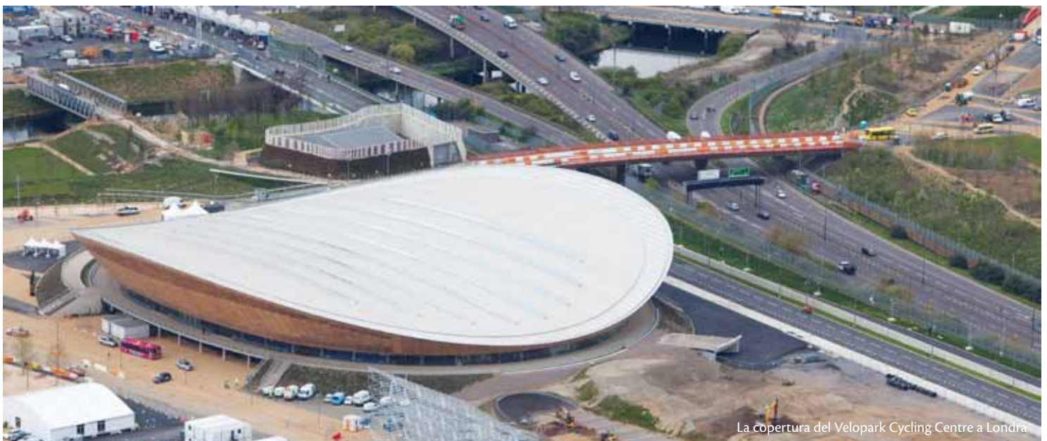
La copertura del Velopark Cycling Centre a Londra

PVC flessibile utilizzato per le coperture del Velopark Cycling Centre e sul tetto dello Stadio olimpico principale a Londra.