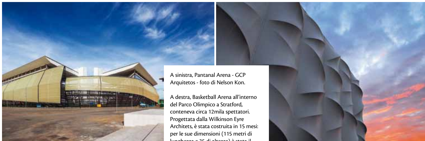
A sinistra, Pantanal Arena - GCP Arquitectos