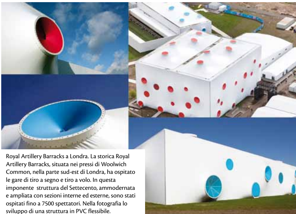
Royal Artillery Barracks a Londra. La storica Royal Artillery Barracks, situata nei pressi di Woolwich Common, nella parte sud-est di Londra, ha ospitato le gare di tiro a segno e tiro a volo. In questa imponente struttura del Settecento, ammodernata e ampliata con sezioni interne ed esterne, sono stati ospitati fino a 7500 spettatori. Nella fotografia lo sviluppo di una struttura in PVC flessibile.

L'utilizzo del PVC, non soltanto nella versione flessibile, è da sempre un argomento controverso al momento della definizione delle strategie di approvvigionamento di materiali per eventi sportivi di grande portata. I Giochi olimpici di Sydney 2000, i Giochi olimpici di Londra 2012 e la Coppa del mondo FIFA di quest'anno sono ottimi esempi di applicazioni innovative del PVC e, al contempo, di come la disinformazione nei confronti di questo materiale possa limitarne l'uso. In risposta alle pressioni esercitate da gruppi ambientalisti, gli organizzatori dei Giochi olimpici di Sydney, i primi mai tenutisi in Australia, hanno adottato una politica molto restrittiva sull'uso del PVC. Il vinile è stato bandito da un'ampia varietà di costruzioni, come fognature, condotti per acqua e acqua piovana e cavi elettrici e per l'illuminazione. Nonostante l'impegno degli organizzatori, sono stati innumerevoli i casi in cui, per motivi funzionali o strutturali, non è stato possibile sostituire il PVC nei cavi di infrastrutture temporanee e permanenti. Passando invece al 2009, la Commissione per Londra 2012 sostenibile, un organismo che aveva il compito di monitorare e di garantire la sostenibilità dei Giochi olimpici, ha delineato le proprie linee guida per l'uso del PVC con particolare attenzione alle applicazioni flessibili contenenti plastificanti. Lungi dal vietarne l'uso, questo organismo ha chiesto ai fornitori di soddisfare requisiti specifici, come