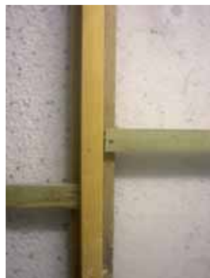
INSUFLAGGIO DI MATERIALE ISOLANTE POLIMERICO NELLA CAVITÀ DI UNA PARETE STORICA

PRESTAZIONI: ISOLANTE SINTETICO: ELEVATA RESISTENZA TERMICA E TRASPIRABILITÀ AL VAPORE, MA NON INERZIA TERMICA ISOLANTE NATURALE: ANCHE SFASAMENTO E ATTENUAZIONE DEL CALORE