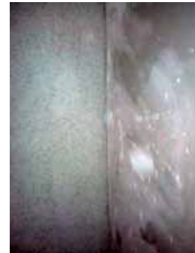
MALTA A BASE DI CALCE APPLICATA IN OPERA ALTAMENTE ISOLANTE.

PRESTAZIONI: ISOLAMENTO TERMICO ( \lambda = 0.0255 \text{ W/mK} CON DENSITÀ DI 70 KG/m 3 ), PERMEABILITÀ AL VAPORE, IGROSCOPICITÀ E RESISTENZA MECCANICA