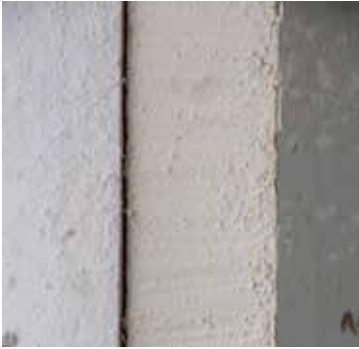
MATERIALE ISOLANTE CAPILLARITÀ ATTIVA.